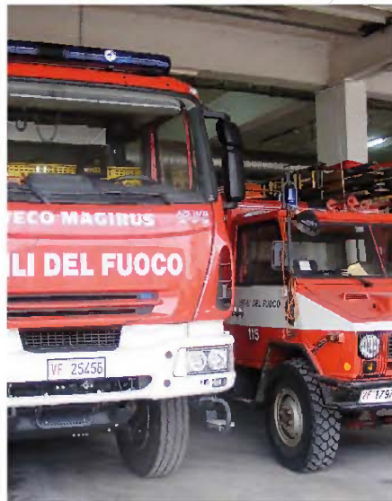
Anche i vigili del fuoco di Udine partecipano alla protesta