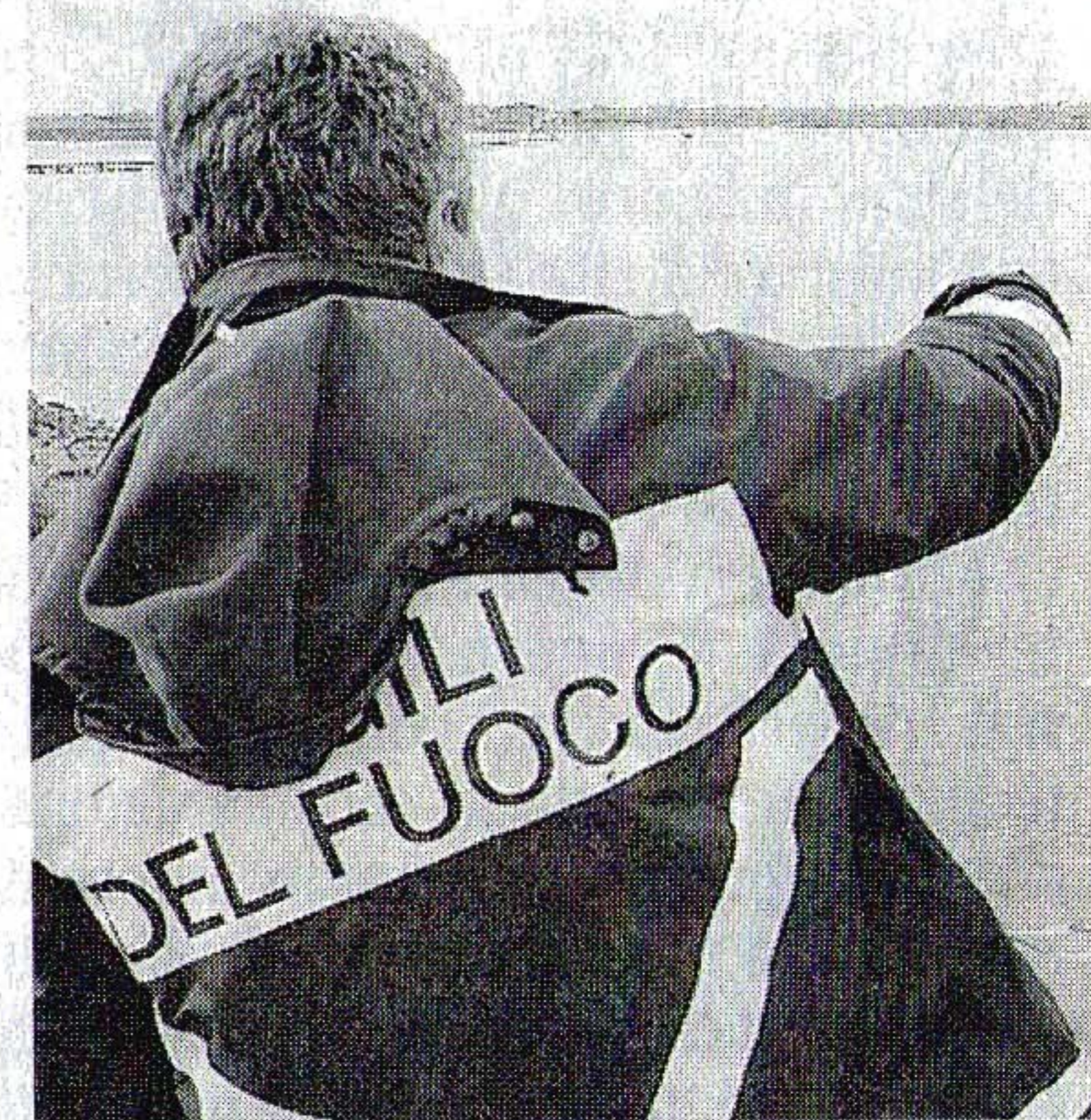
PROTESTANO I VIGILI DEL FUOCO