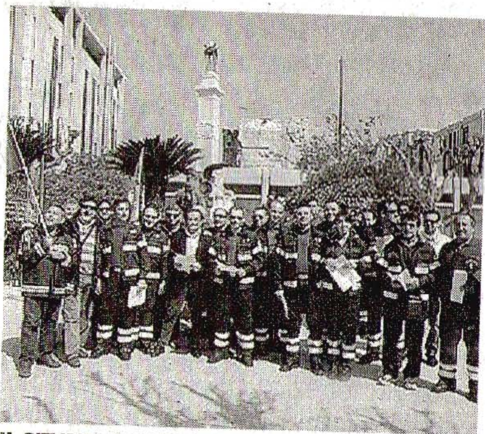
IL SIT IN DAVANTI ALLA PREFETTURA

Ieri il sit in di protesta davanti alla Prefettura. Quattro ore di sciopero. «Chiediamo un contratto rispettoso»