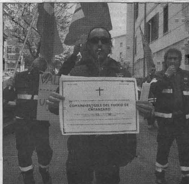
Due momenti della manifestazione indetta dai vigili del fuoco

problematica nazionale che vede i vigili del fuoco senza contratto da circa 3 anni e con carenza di personale».