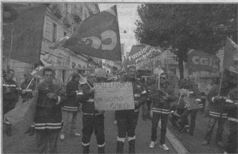
Alcuni momenti della manifestazione dei vigili del fuoco di Conapo e Fp Cgil