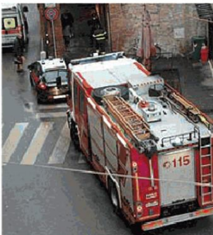
Un intervento dei vigili del fuoco

Così come i servizi di disinfezione da vespe in caso di problemi per persone con allergie o a rischio, come anziani e bambini.