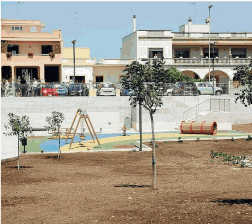
IL NUOVO PARCO URBANO Spazi verdi e giochi per i bambini