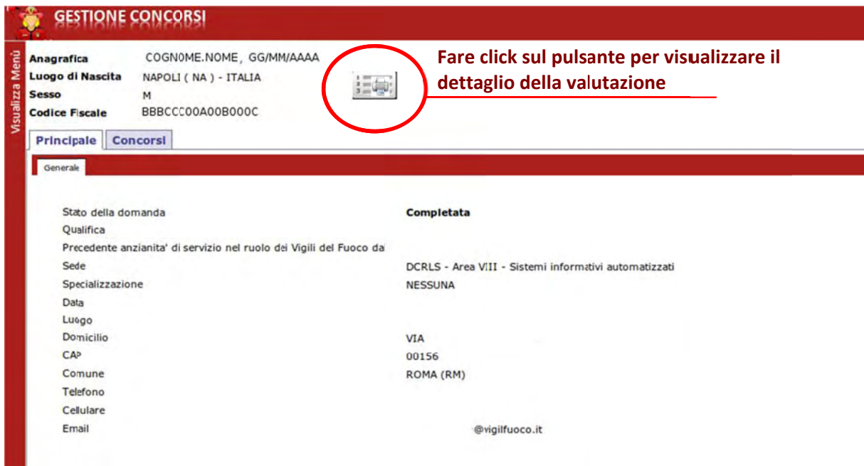
Figura 3 - Dettaglio Informativo della domanda del candidato