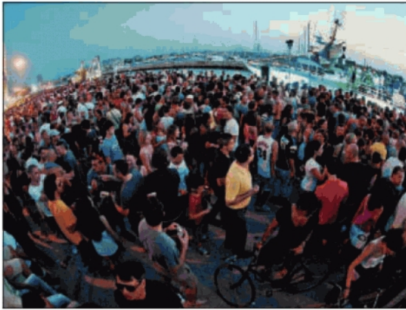
Il pubblico della Molo street parade