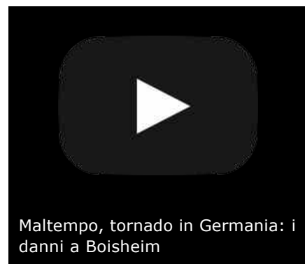
Maltempo, tornado in Germania: i danni a Boenheim