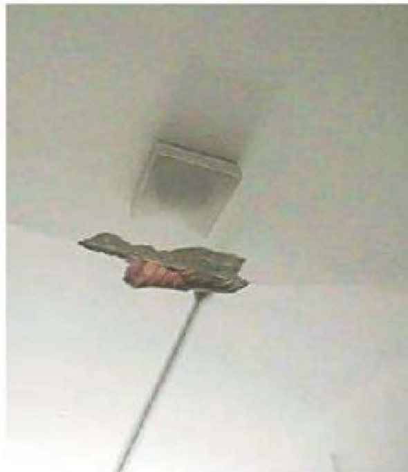
Il cedimento nel soffitto