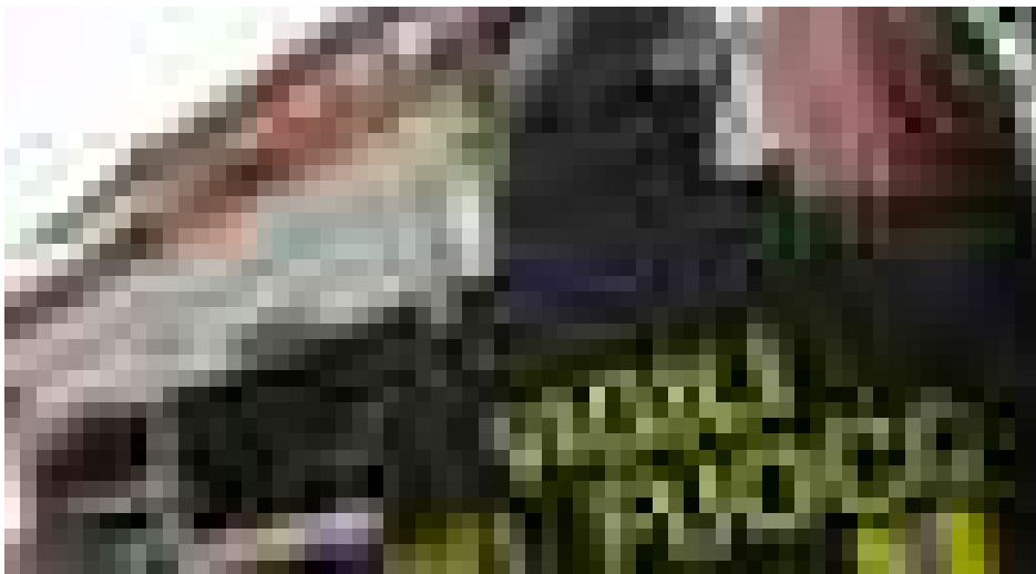
Vigili del fuoco in azione

Lucca, 9 gennaio 2019 - Una porzione di intonaco del soffitto è caduta oggi in una camerata del comando dei vigili del fuoco di Lucca , situato in un immobile di proprietà della Provincia lucchese concesso in locazione al Corpo nazionale dei Vvf. Nessun ferito. Lo rende noto il sindacato autonomo Conapo ricordando che 10 giorni fa aveva presentato un esposto alla procura di Lucca per «le condizioni di fatiscenza e pericolosità dell'immobile anche ai fini della sicurezza sul lavoro».